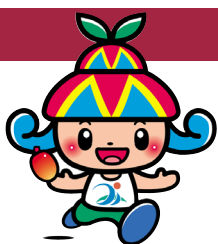
宮古島市イメージキャラクター 「みーや」